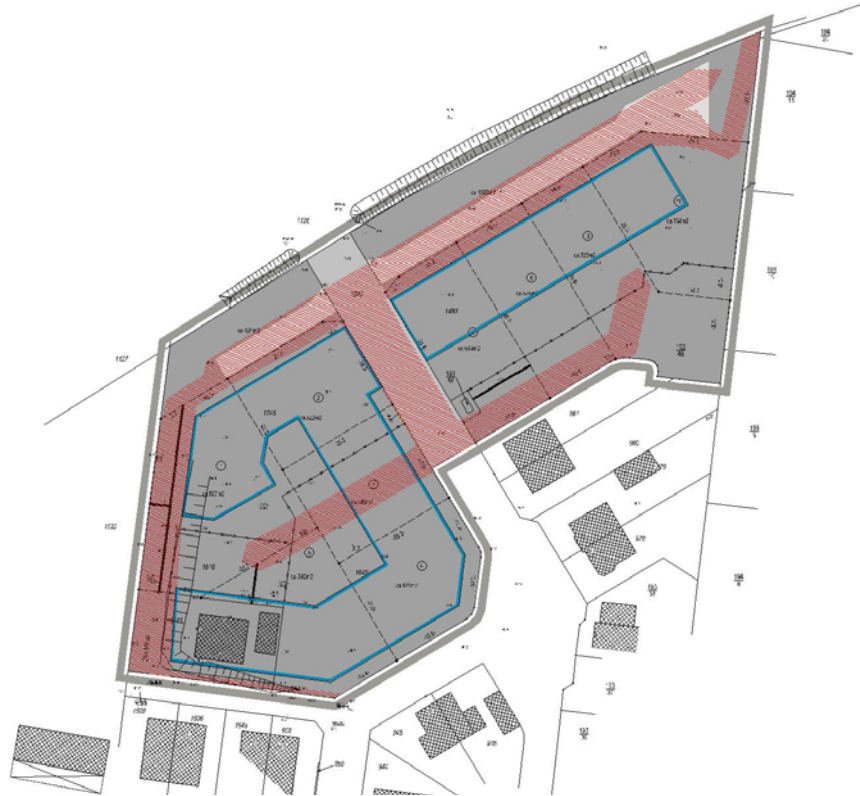
Schutzabstände zu vorhandenen Leitungen

Die Stadt Cottbus als öffentlich- rechtlicher Entsorgungsträger betreibt die Abfallentsorgung satzungsgemäß im Rahmen ihrer Pflichten nach dem Kreislaufwirtschaftsgesetz. Die Erfüllung dieser Aufgabe erfolgt über Vertragspartner.