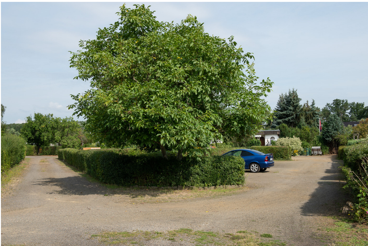
Blick im Osten innerhalb der Kleingartenanlage nach Norden auf bestehende Park- und Grünflächen