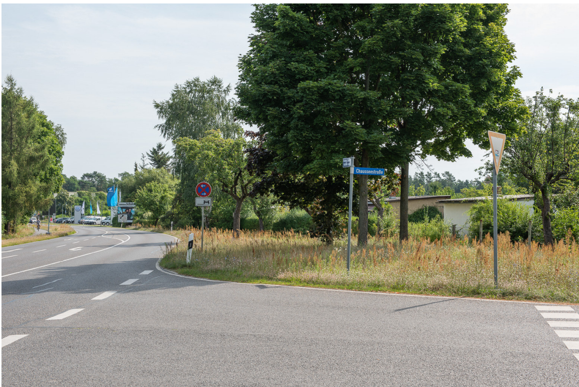
Blick vom Westrand des Plangebiets nach Nordosten entlang der Madlower Chaussee auf den Rand der Kleingartenanlage