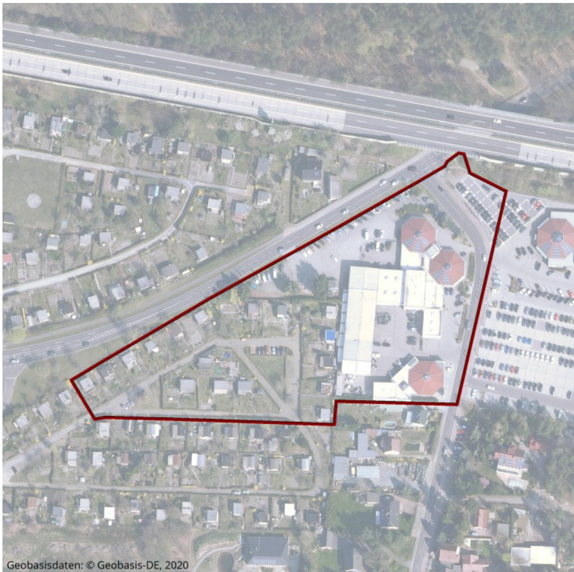
Abb. 1: B-Plangebiet (rot umrandet) „Erweiterung Autohaus Schulze“, Luftbild