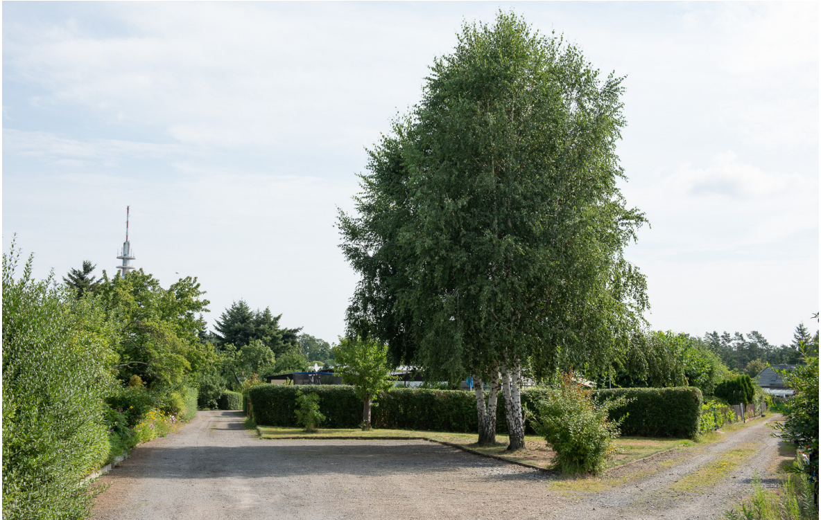
Blick im Westen innerhalb der Kleingartenanlage nach Nordosten auf bestehende Frei- und Gemeinschaftsflächen