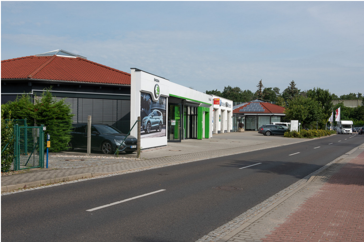
Blick vom Südostrand des Plangebiets nach Nordwesten entlang der Harnischdorfer Straße auf das bestehende Gewerbegebiet des Autohauses