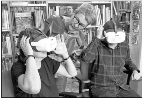
Mitarbeiter testen das neue Angebot.

Es ist wieder soweit. Wir geben für Ihre Erstklässler zum Schulanfang die kostenlose Bibo-Card aus. Bis 13 Jahre bleibt die Anmeldung entgeltfrei. So cool wie der kleine Kerl auf dem Ausweis aussieht, so cool ist unsere Bibo. Und das Beste: Lieblings- und Erstlesebücher, Geschichten und Musik auf CD oder Spiele können von den Kindern endlich selbst ausgeliehen werden. Auch Tonies, Tiptoi-Medien, LÜK, Sami-Lesebären und Konsolenspiele gehören zum Bestand. Bibo-Card-Abholer erhalten zusätzlich eine „Tüte“ mit Pixi-Büchlein, kleinen Überraschungen und Infos zur Bibliotheksnutzung.