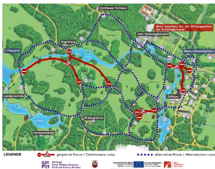
Übersichtskarte mit markierten Wegesperrungen und Alternativrouten