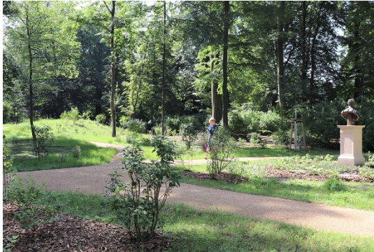
Neue Wege im Rehgarten